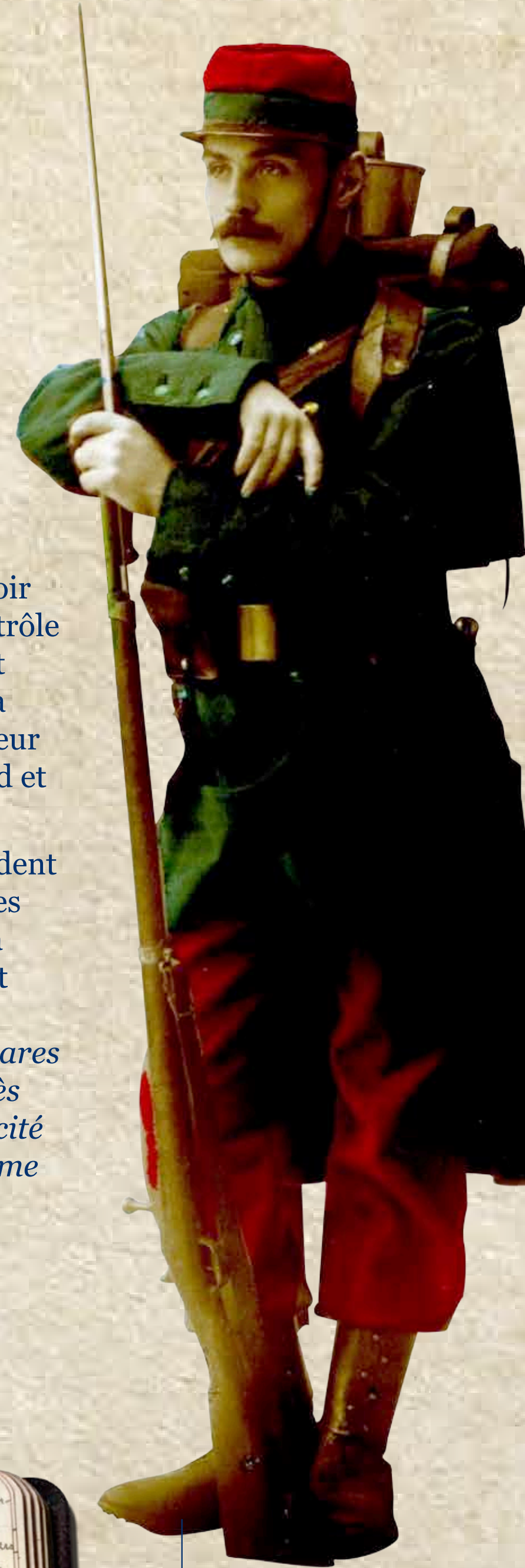
Uniforme avec le pantalon rouge dit « garance » et équipement du soldat portés lors du départ en août 1914. (AD71, Grande Collecte n°1131, D. Roudier)

Nerveux et avides d'informations, les gens se rendent dans les mairies et les bureaux de poste, devant les sièges des journaux et des banques pour glaner la moindre nouvelle. Le Lyon Républicain du 3 août déclare : « Peu ou pas de nouvelles : téléphone, télégraphe accaparés ne laissent passer que de rares informations et celles publiées par la presse après un contrôle sévère sont les seules dont l'authenticité soit certaine ; les autres doivent être tenues comme tendancieuses. »