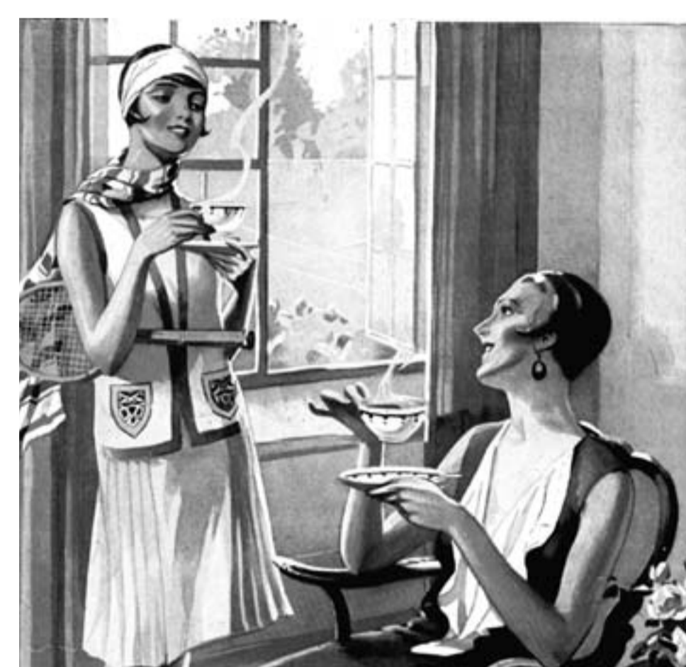
La publicité utilise l'image de la garçonnette (PR56/104, année 1930)

Malgré cette législation, des comportements d'émancipation se dessinent notamment dans les élites intellectuelles. La nouvelle silhouette de la garçonnette , icône des années 1920 tirée du roman de Victor Marguerite, symbolise une certaine liberté (cheveux courts, fin du corset).