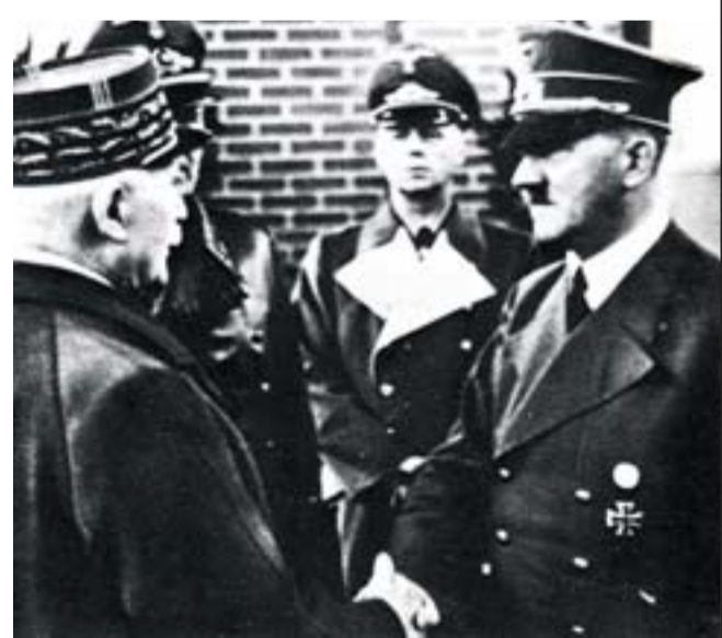
(BH GF 262)

1943 Février 12 : Création du Service du Travail Obligatoire (STO). Décembre 29 : Création des Forces Françaises de l'Intérieur (FFI). 1944 Avril 21 : Ordonnance du Gouvernement Provisoire de la République Française , installé à Alger et dirigé par Charles de Gaulle, par laquelle les Françaises deviennent électrices et éligibles dans les mêmes conditions que les hommes. Juin 6 : Débarquement allié en Normandie. 10 : Massacre d'Oradour-sur-Glane par la division das Reich (plus de 600 morts). Juillet Début de la libération des camps. Mois 15 : Débarquement allié en Provence. 25 : Libération de Paris. Septembre 3 : Libération de Lyon. 1945 Avril 29 : 1 er vote des françaises aux élections municipales. Mai 8 : Capitulation du III e Reich. Août 6 : 1 ère bombe atomique américaine sur Hiroshima. 9 : 2 nde bombe atomique américaine sur Nagasaki. 15 : Pétain est accusé par la justice française d'intelligence avec l'ennemi. Novembre 14 : Ouverture du procès des criminels de guerre nazis à Nuremberg. 1949 Mars 2 : suppression du rationnement en France.