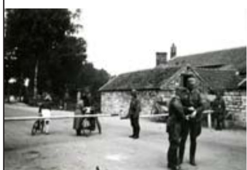
Poste de contrôle sur la ligne de démarcation, Lux