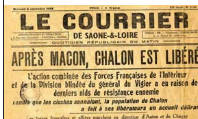
Mâcon est libéré le 4 septembre, Chalon le 5 (PR 13/205)