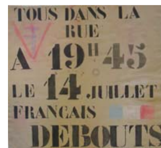
Affiche clandestine, Cormatin, 1943