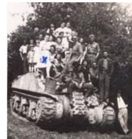
Louhans libéré