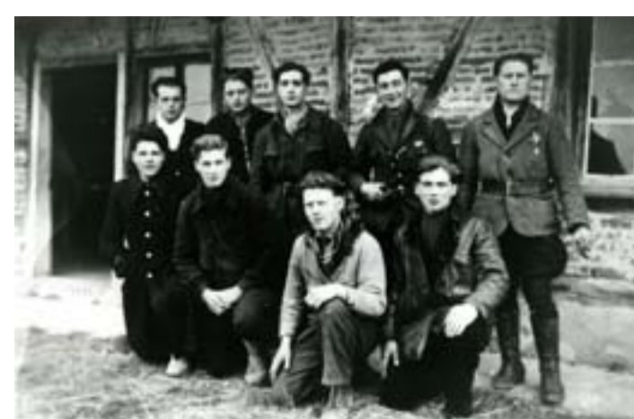
Maquis de Brancion

1943 Février 12 : Création du Service du Travail Obligatoire (STO). Décembre 29 : Création des Forces Françaises de l'Intérieur (FFI). 1944 Avril 21 : Ordonnance du Gouvernement Provisoire de la République Française , installé à Alger et dirigé par Charles de Gaulle, par laquelle les Françaises deviennent électrices et éligibles dans les mêmes conditions que les hommes. Juin 6 : Débarquement allié en Normandie. 10 : Massacre d'Oradour-sur-Glane par la division das Reich (plus de 600 morts). Juillet Début de la libération des camps. Mois 15 : Débarquement allié en Provence. 25 : Libération de Paris. Septembre 3 : Libération de Lyon. 1945 Avril 29 : 1 er vote des françaises aux élections municipales. Mai 8 : Capitulation du III e Reich. Août 6 : 1 ère bombe atomique américaine sur Hiroshima. 9 : 2 nde bombe atomique américaine sur Nagasaki. 15 : Pétain est accusé par la justice française d'intelligence avec l'ennemi. Novembre 14 : Ouverture du procès des criminels de guerre nazis à Nuremberg. 1949 Mars 2 : suppression du rationnement en France.