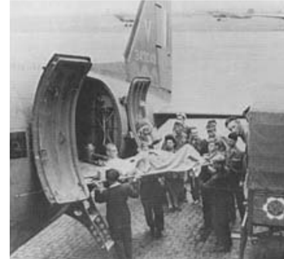
Rapatriement de déportés en avion