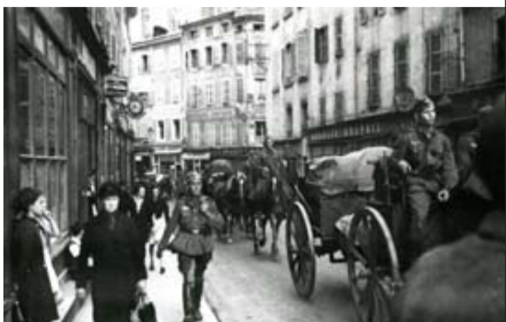
Entrée des troupes allemandes dans Mâcon, 19 juin 1940 (collection privée)