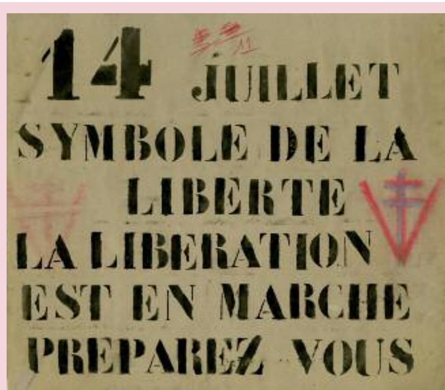
Affiche sur papier peint saisie par la police à Cormatin le 14 juillet 1943. (AD71).

Les commémorations nationales (14 juillet, 11 novembre), interdites par l'occupant, donnent lieu à une communication clandestine particulièrement abondante.