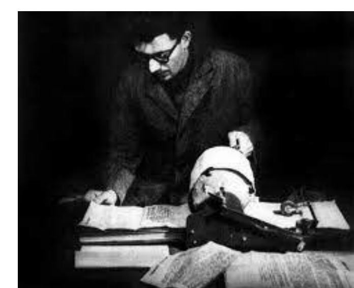
L'imprimerie ronéo : de petites dimensions, ces machines s'installent sur une table et fonctionnent à la main. Le tirage peut atteindre les 700 à 800 exemplaires à l'heure. Exemple du colonel Guingouin du maquis du Limousin.

D'innombrables "papillons" et tracts paraissent épisodiquement à l'initiative de groupes d'opinions très variées. La plupart sont de simples feuillets, dactylographiés ou imprimés, généralement reproduits en quantité limitée sur ronéotype .