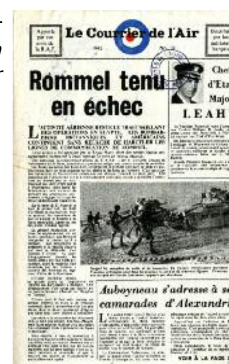
En 1941, Le Courrier de l'Air est diffusé en Saône-et-Loire par l'aviation alliée. (W109299).

Les radios étrangères , particulièrement réactives aux événements, réputées plus objectives que les médias français, ont bénéficié d'une forte audience auprès de la population malgré l'interdiction qui leur était faite de les écouter.