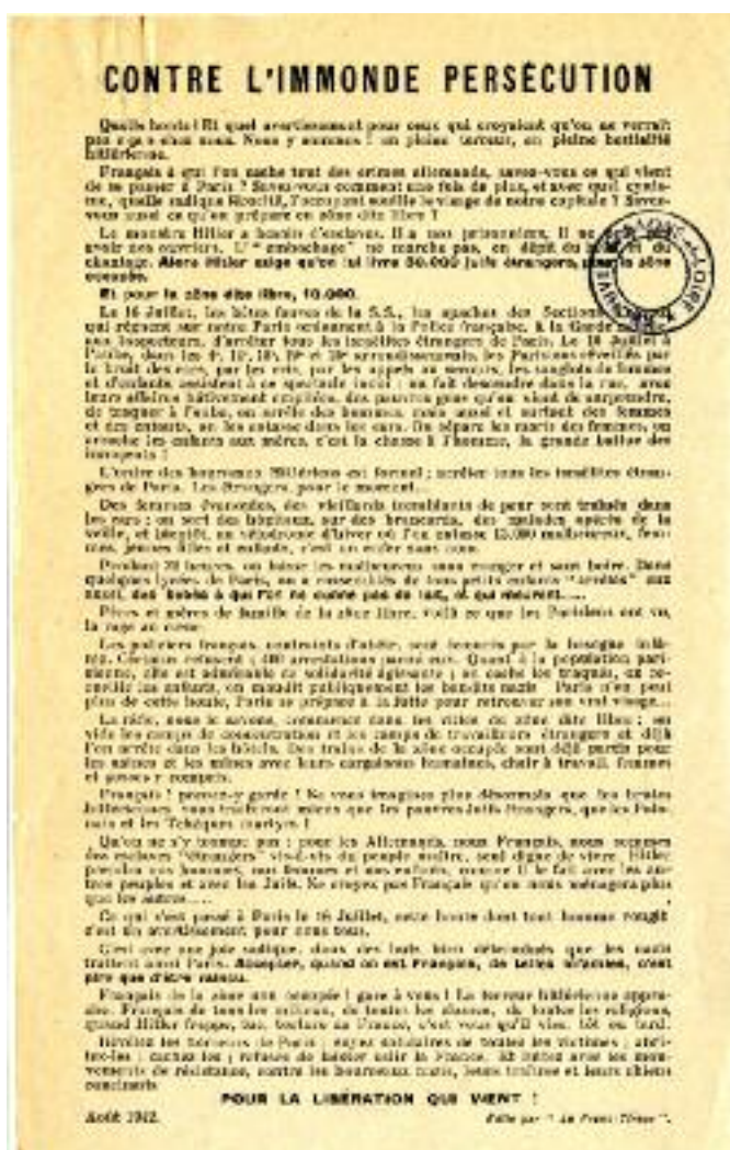
Tract du Franc-Tireur sur la rafle du Vel' d'Hiv. (13,30 x 21,5 cm, août 1942, W109299).