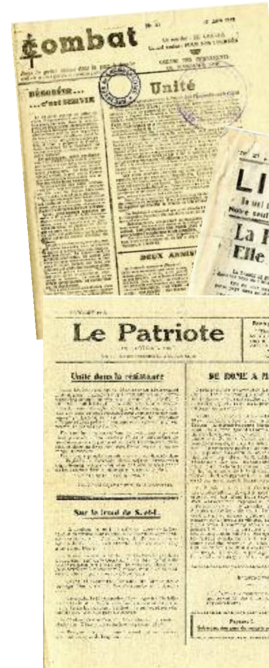
En décembre 1941, Henry Frenay édite le premier n° du journal Combat. (14,2 x 17,5 cm, du 15 juin 1943, W109299).

"Environ deux kilogrammes de publications ( Combat , Libération , Après et surtout Le Patriote de Saône-et-Loire ) ont été saisis. La distribution de ces journaux a été faite dans la nuit du 13 au 14 juillet 1943 à Charolles, entre minuit et minuit trente, par deux jeunes gens. Surpris par les gendarmes G. et T., embusqués dans la rue Gambetta, les auteurs du délit ont réussi à s'échapper." (1W109299)