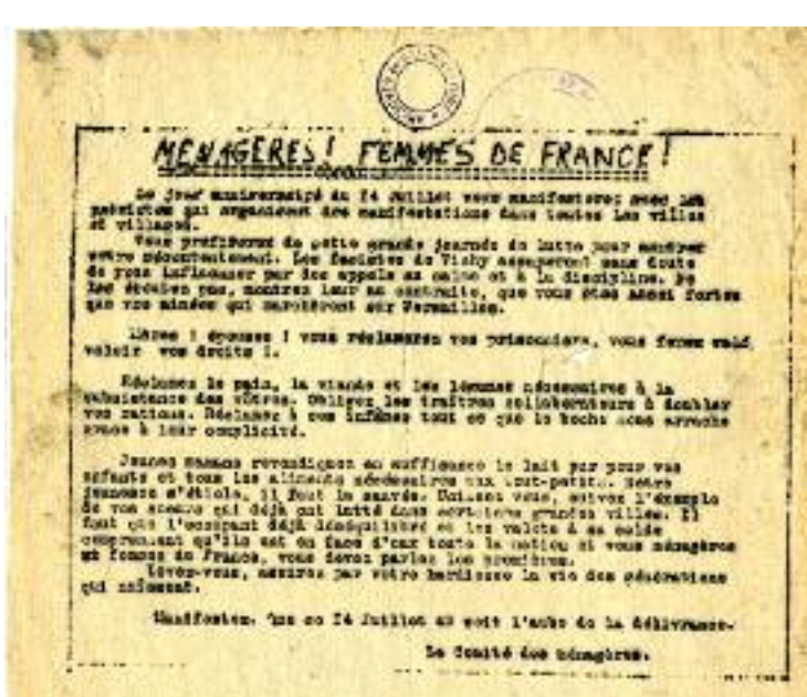
Tract du Comité des ménagères. (22x19 cm, juillet 1943, W109299).

Des groupes, qui deviendront ensuite des mouvements de résistance , organisent clandestinement l'impression et la diffusion de journaux réguliers à fort tirage. Les journaux des Mouvements Unis de la Résistance comme Combat , Libération , Franc-Tireur sont parmi les titres les plus diffusés. La majorité des imprimés circulant en Saône-et-Loire provient de Paris, Dijon mais surtout de Lyon, capitale de la presse clandestine .