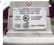
A Frotey-lès-Lure (Haute-Saône).

Sur les lieux mêmes des combats, des stèles rendent hommage aux unités combattantes saône-et-loiriennes.