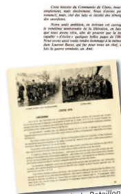
Histoire du 4 ème Choc, 1974.

Pour témoigner de leur parcours et de leur engagement, les "anciens" écrivent.