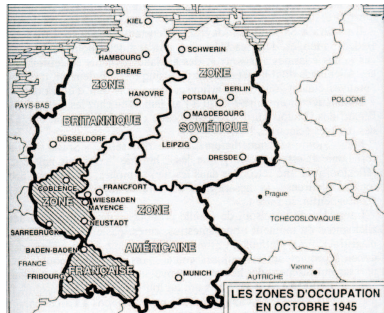
L'Allemagne est divisée en quatre zones alliées d'occupation. La France occupe le Wurtemberg-Hohenzollern, la Bade (quartier général à Baden-Baden) et la Rhénanie-Palatinat.

Les engagés volontaires de Saône-et-Loire ont été sur tous les fronts de la campagne de libération de la France, dans la 1 ère Armée française (puis Rhin et Danube) du général de Lattre, dans l'Armée des Alpes, dans la 2 e DB du général Leclerc, pour libérer Strasbourg et les poches de l'Atlantique.