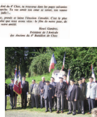
70 ans après, le 20 septembre 2014, les hommes du 4 ème Choc se retrouvent à Bergersheim pour leur commémoration.