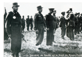
Le général de Gaulle sur le front de Royan-Poitevin, le 20 avril 1945. Au premier plan le général de Larminat.