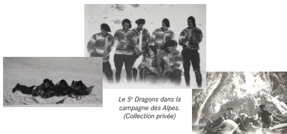
Le 5 e Dragons dans la campagne des Alpes.