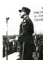
Le 8 juin 1947, le général de Lattre inaugure le monument du Bataillon du Charollais à Beaubery.

Des monuments ont été érigés à la mémoire des engagés tombés dans les différentes campagnes. Dans l'immédiat après-guerre, des personnalités militaires viennent honorer les bataillons de Saône-et-Loire, au premier rang desquelles le général de Lattre.