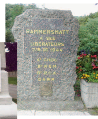
A Rammersmatt (Haut-Rhin).

Pour témoigner de leur parcours et de leur engagement, les "anciens" écrivent.