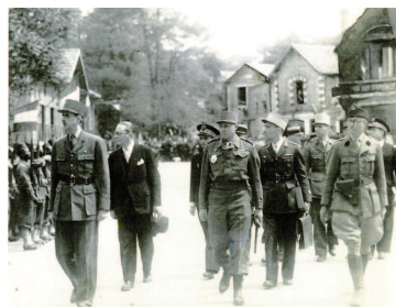
A Cognac, le 18 septembre 1944, les généraux de Gaulle et de Larminat passent en revue les soldats qui assiègent les Allemands retranchés dans les poches de l'Atlantique.

forces françaises de l'ouest (FFO), constituées essentiellement d'anciens FTP et FFI.