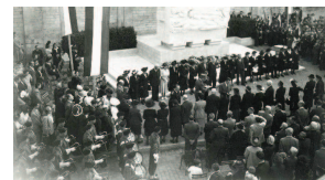
Le 16 août 1948, à Cluny pour le 4 ème Choc.

Sur les lieux mêmes des combats, des stèles rendent hommage aux unités combattantes saône-et-loiriennes.