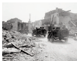
Des éléments de la 2 ème DB à Royan, avril 1945.

viennent se joindre aux unités de la Résistance locale. Du 15 au 17 avril, les chars et l'artillerie avancent et prennent l'estuaire de la Gironde. L'essentiel de la poche est conquis, suivi par la reddition des 4000 défenseurs de la pointe de Grave le 20 avril et par l'investissement de l'île d'Oléron le 30 avril. Les redditions de La Rochelle (7 mai), Saint-Nazaire et Lorient (8 mai), Dunkerque (9 mai) se font sans combat.