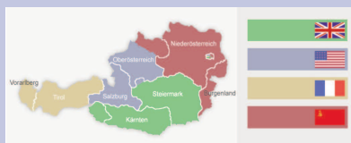
Le Tyrol et la région du Vorarlberg sont sous commandement français.

L'Autriche est également divisée en 4 zones d'occupation alliées.